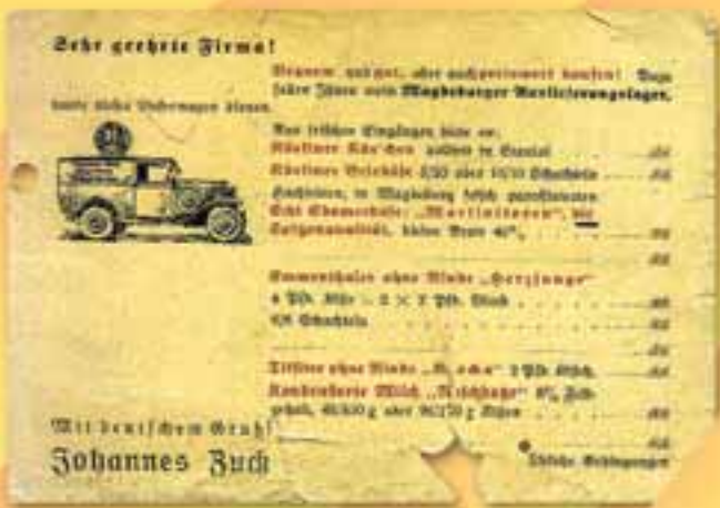
Angebot von 1934

1928: Durch Inflation Einstellung der Pflaumenmusproduktion, dafür Aufbau Käseim- 1934: Zu Käse kommt eine Butterausformstation in neuen Räumen in Groß-Ottersleben.