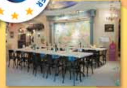
Das erste Käse-Center Europas