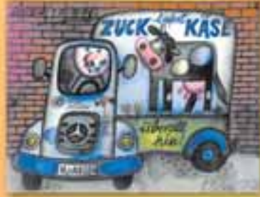
Der Fuhrpark unter dem Motto: ZUCK liefert Käse aus aller Welt.

EINLADUNG zum 04. bis 06. Juli 2004 Große Käseausstellung anlässlich 101 Jahre ZUCK Herzlich willkommen!